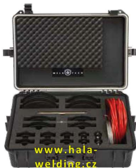
PURGE FLEX BOX (EZPF99) Kompletní set pro sváření potrubí 1" - 6" (25 - 165 mm)