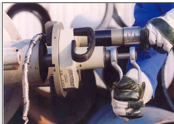
US 40 s elektrickým pohonem